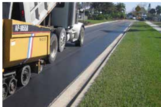
Imagen 6: Todos los tipos de máquinas de pavimentación pueden circular encima del GlasPave.