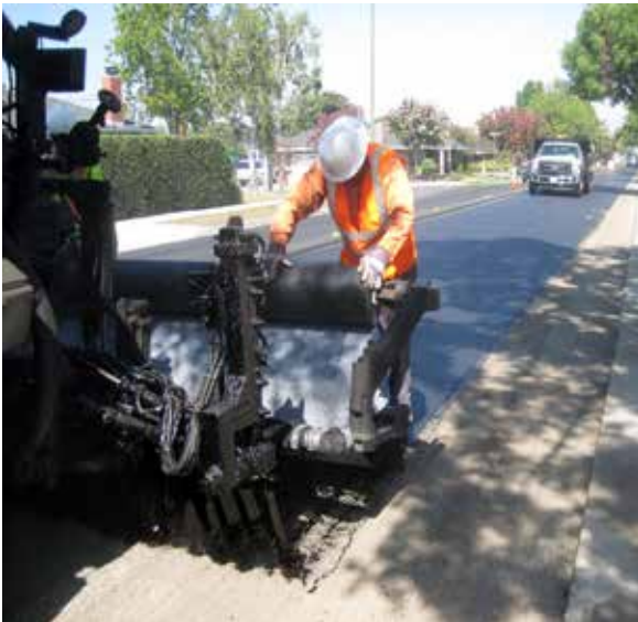
Imagen 2: Camión distribuidor con un aplicador de tela adjunto a la parte posterior