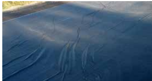
Imagen 5: Las arrugas mayores de 25 mm deben ser cortadas y traslapadas en la dirección de la pavimentación.