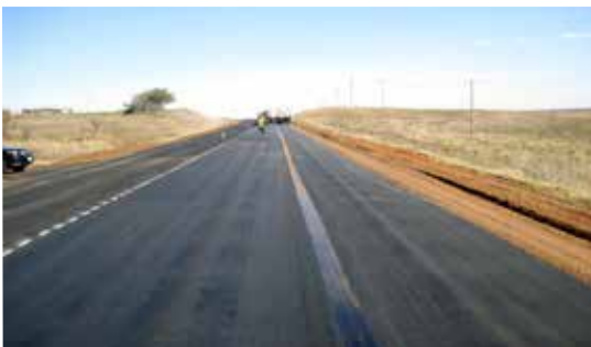
Imagen 3: Todo el GlasPave adyacente debe ser traslapado.