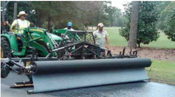
Imagen 1: Equipo de colocación de capas intermedias

El geocompuesto para impermeabilización y pavimentación GlasPave® es una combinación única de malla de fibra de vidrio embebida entre dos capas de poliéster de alto desempeño. GlasPave ofrece la resistencia a la tracción más alta (25 kN o 50 kN) en el mercado en comparación con cualquier otro geocompuesto de pavimentación o tejido. El diseño distintivo fue optimizado para fácil instalación y realizar el máximo rendimiento.