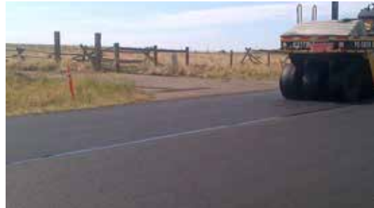
Imagen 4: Utilice un rodillo neumático para unir el GlasPave instalada a la capa adhesiva.